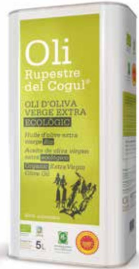
5 litres · BIO