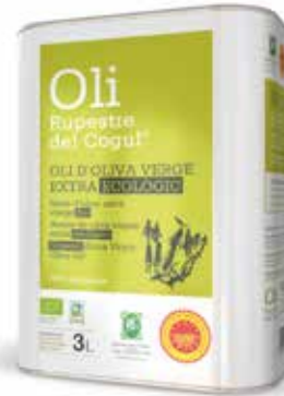
3 litres · BIO