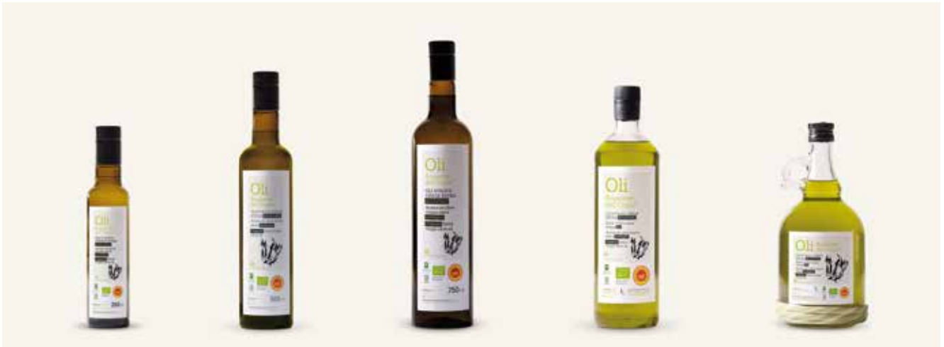
25 cl · BIO