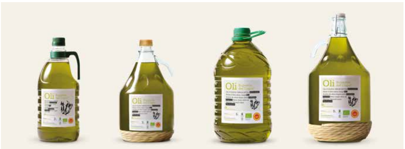
2 litres · BIO